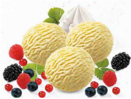
Coupe Hot Berry Vanille- Glacé mit heissen Waldbeeren und Rahm