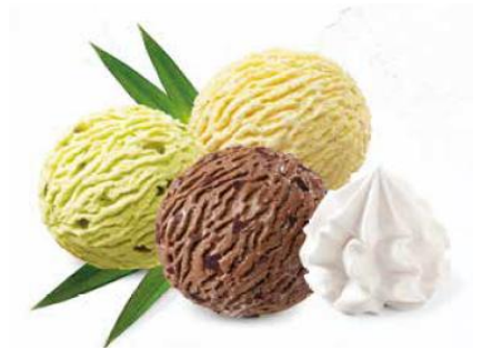
Eis-Kaffee Kaffee- Glacé und Rahm